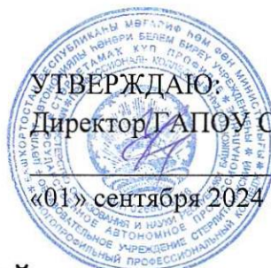
ГРАФИК ПРОМЕЖУТОЧНОЙ АТТЕСТАЦИИ на первое полугодие 2024-2025 учебного года 09.01.03 Оператор информационных систем и ресурсов